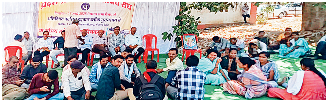
जनपद पंचायत बेरला के पंचायत सचिवों ने शुरु की हड़ताल